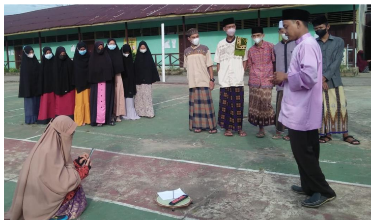
Gambar 8. Narasumber menjelaskan cara observasi bayangan Matahari

Setelah menyelesaikan materi sesi 2 pada pukul 16.10 WIB, kegiatan dilanjutkan dengan observasi bayangan Matahari untuk penentuan arah kiblat atau rashdul kiblat global yang tahun ini jatuh pada tanggal 15 Juli 2021. Kegiatan observasi dilakukan di lapangan Voli. Pertama-tama, dilakukan persiapan terlebih dahulu antara lain penyiapan istiwaaini rancangan K.H. Slamet Hambali yang terdiri atas papan dial, gnomon (tongkat istiwa ), kaki penyangga, dan waterpass. Selanjutnya, istiwaaini diletakkan di lapangan observasi. Sebelum siap digunakan, peserta diingatkan untuk mengecek kedataran papan dial dengan waterpass. Narasumber juga menjelaskan bahwa selain istiwaaini , pengamatan dapat pula menggunakan tali yang digantungkan bebas dengan posisi seperti seorang pemancing memegang stik pancingan. Cuaca pada saat pengamatan sangat mendukung sebab piringan Matahari tampak seluruhnya dan tidak ada halangan berupa awan. Kondisi ini menyebabkan bayangan gnomon terlihat jelas.